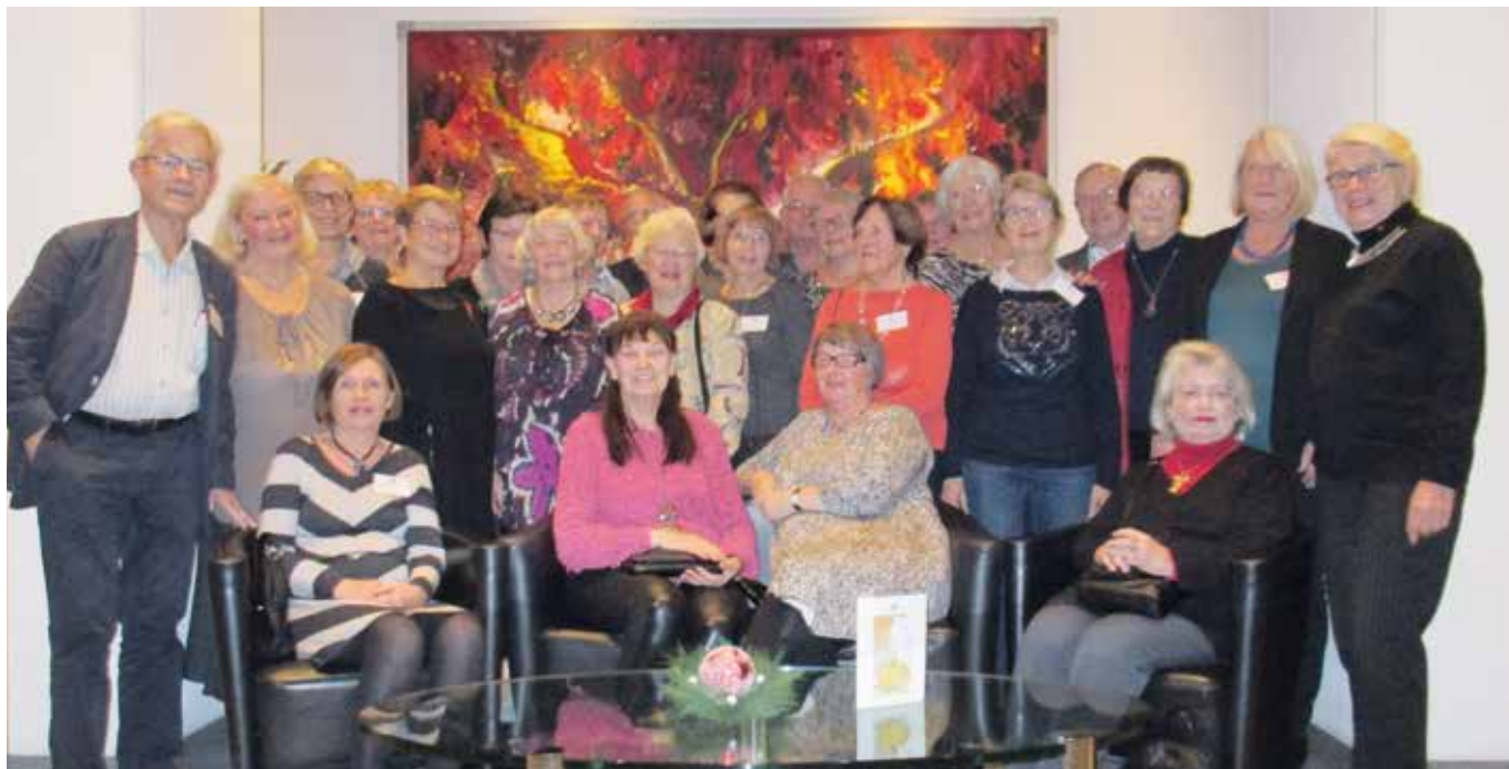
Alle deltakerne samlet foran et av de mange kunstverkene på hotellet.

marked – Weinachts-Zauber («jule-trolldom») med utrolig mange potensielle julegaver til salg. I noen telt kan man få en varm lunsj i ly for den isnende vinden. (Lufttemperaturen på dagen lå omkring frysepunktet, så det var godt med solide norske vinterklær.) Fire av oss