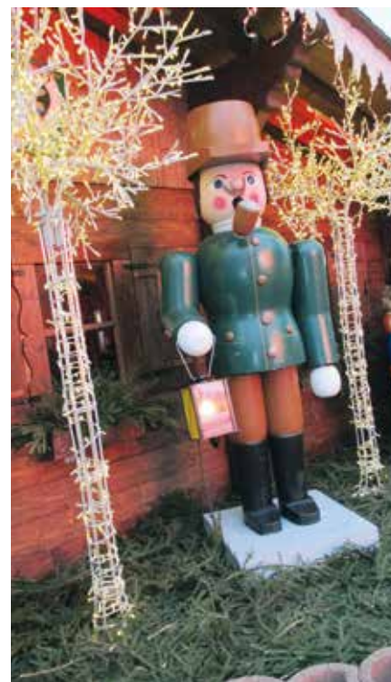
Fargerik vekter på julemarked!

Den siste formiddagen var til eget bruk – julegavehandel, byvandring eller en siste økt i hotellets svømme-