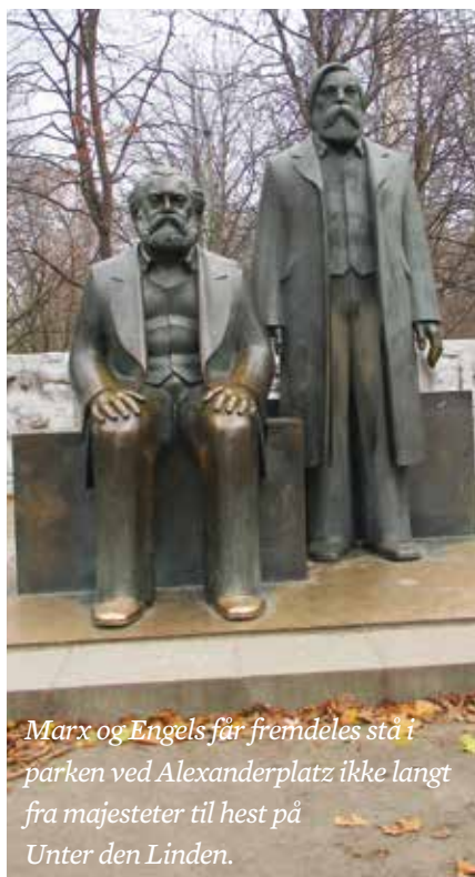
Marx og Engels får fremdeles stå i parken ved Alexanderplatz ikke langt fra majesteter til hest på Unter den Linden.

marked – Weinachts-Zauber («jule-trolldom») med utrolig mange potensielle julegaver til salg. I noen telt kan man få en varm lunsj i ly for den isnende vinden. (Lufttemperaturen på dagen lå omkring frysepunktet, så det var godt med solide norske vinterklær.) Fire av oss