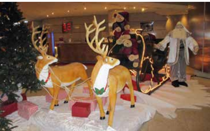
Julepyntet vestibyle på hotellet!