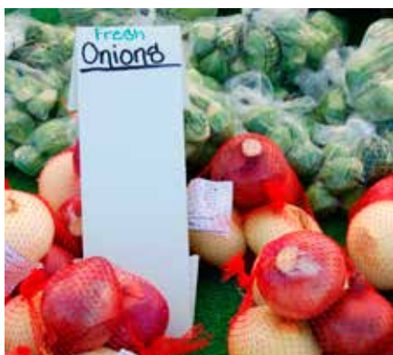
Frisk løk på gatemarkedet i Loma Linda i California.

ligger i Sør-California, USA, befolkning: 21 000.