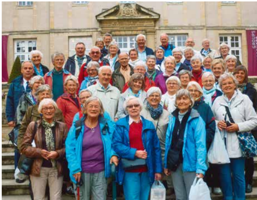
Vi har sett Bayeux-teppet

På dag tre gikk turen til Bayeux hvor vi fikk se det kjente 70 meter lange håndsydde Bayeux-teppet hvor motivene er hentet fra slaget i Hastings i 1066. Imponerende. Turen gikk videre til Mont Saint