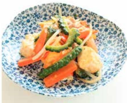
Okinawa cuisine: Chanparu melon med svinekjøtt stekt i tofu.

liv. Tidligere tiders harde dager har de lært å legge bak seg, samtidig som de nyter hver dags enkle gleder.