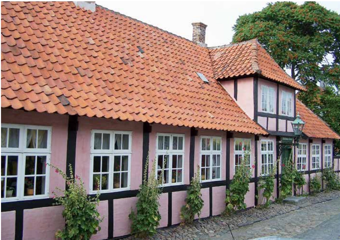
Rønne Ericsons Hus.

15 forventningsfulle og flotte pensjonister møtte på Sola 21.mai for en femdagers tur til Bornholm. Av disse var det 12 damer og tre menn, en liten, men fin gruppe. På hotell Siemens Gaard i Svaneke kommenterte de oss som en vennegjeng!