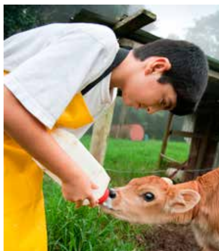
Ung gutt med forkle forer en kommende melkeprodusent i Costa Rica.

ligger i Costa Rica, Latin-Amerika, befolkning: 47 000.