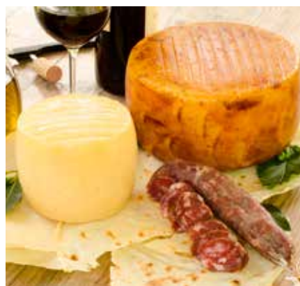
Middelhavskost fra Sardinia.

øy som ligger vest for det italienske fastlandet, befolkning: 1,6 mill.