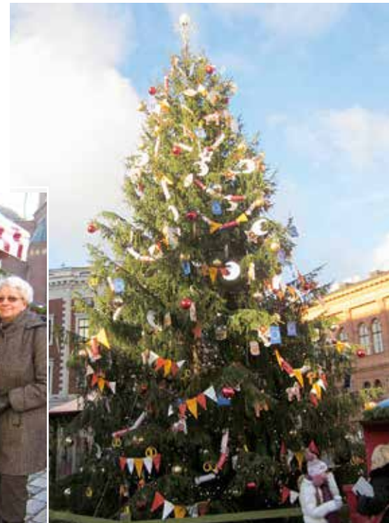
Veldig pyntet juletre på et av markedene

Torsdag, som skulle være siste dag i Riga, ble de siste innkjøp foretatt før vi pakket og kjørte buss til Jurmala på ”Den Baltiske riviera”. Rivieraen her, med flotte sandstrender langs