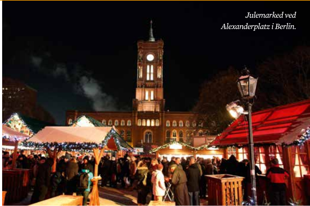
Julemarked ved Alexanderplatz i Berlin.

LOPs turutvalg arrangerer en tur til Berlin med avreise fredag 28. november og retur onsdag 3. desember . Turutvalget står som ansvarlig arrangør. Prisen, som