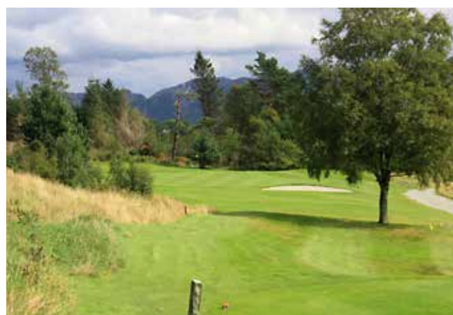
Hull 16 fra teested.

Meld deg på og prøv selv. De som begynner med golf angrer bare en ting, og det er at de ikke begynte før!