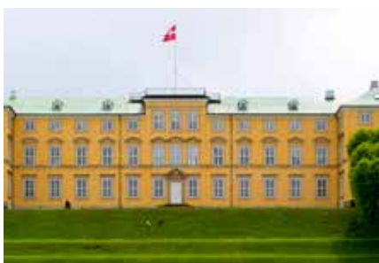
Ill.foto: Fredriksberg, Danmark.

Turutvalgets arbeid med reisevirksomhet bør også kunne ses i sammenheng med de reisetilbud større lokallag gir.