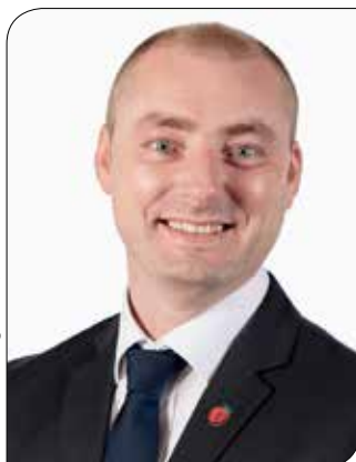
Robert Eriksson, arbeids- og sosialminister

I tillegg til vanlige landsmøteforhandlinger blir flere innkomne forslag fra lokallagene behandlet.