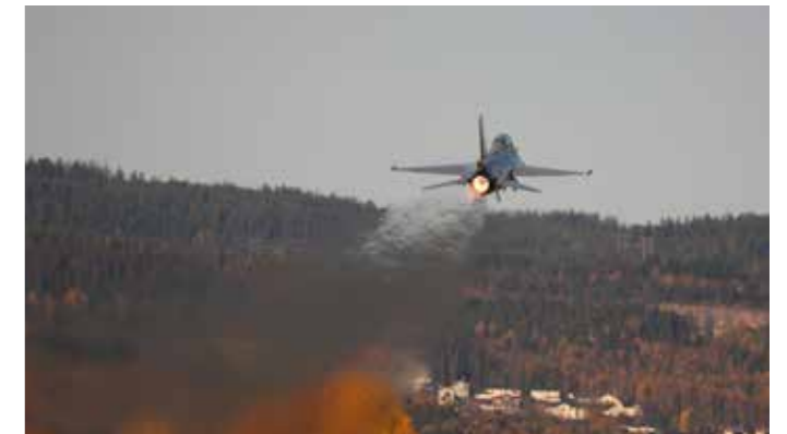
F-16 i avgang

Luftforsvarets hovedverksted ble senere et statsforetak, AIM (Aerospace Industrial Maintenance), for deretter å bli en del av Kongsberggruppen (Kongsberg Aviation Maintenance Services). Tomten KAMS besitter ble dessverre solgt til et eiendomsutviklingsfirma. Imidlertid er store deler av anleggene på Kjeller foreslått vernet av Riksantikvaren. En interessegruppe, Kjeller Fly historiske Kulturpark (KFK) arbeider for