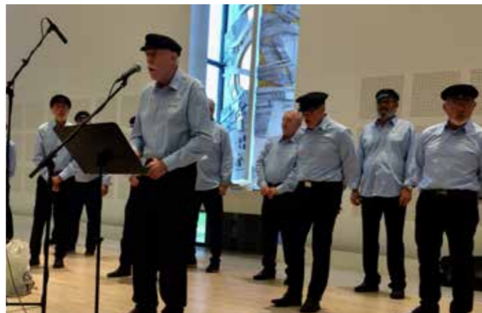
Shantykoret Nattrutens Venner

Det er ikkje berre enkelt å gjennomføre medlemsmøter i tider som desse, men med solid planlegging, omtanke og, ikkje minst, romsleg velvilje frå framømte medlemmer, lar det seg gjere.