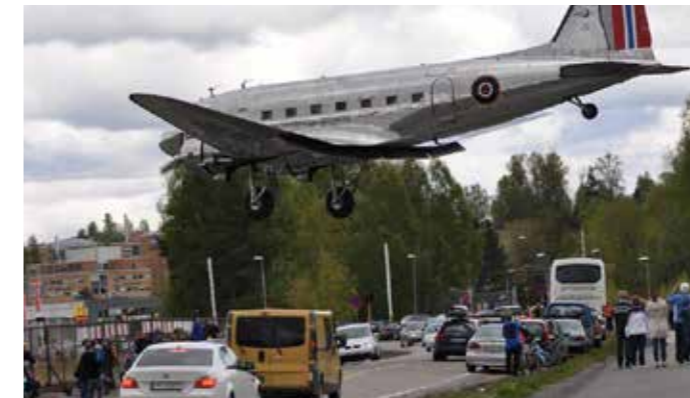
Bilder fra Kjeller flyplass

Skadede fly fra «fortsettelseskrigen» i Finland og deler av Østfronten ble fraktet til Kjeller via Sverige for å bli satt i luftdyktig stand. Både BMW og Mercedes hadde sine egne verksteder her. Litt av BMW's bygg står igjen. Her holder Vera's frisørsalong, Heimevernet og flyklubben «Fly 1912» til nå.