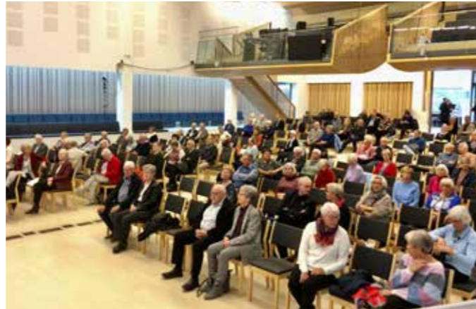
Møtelyden 21. oktober