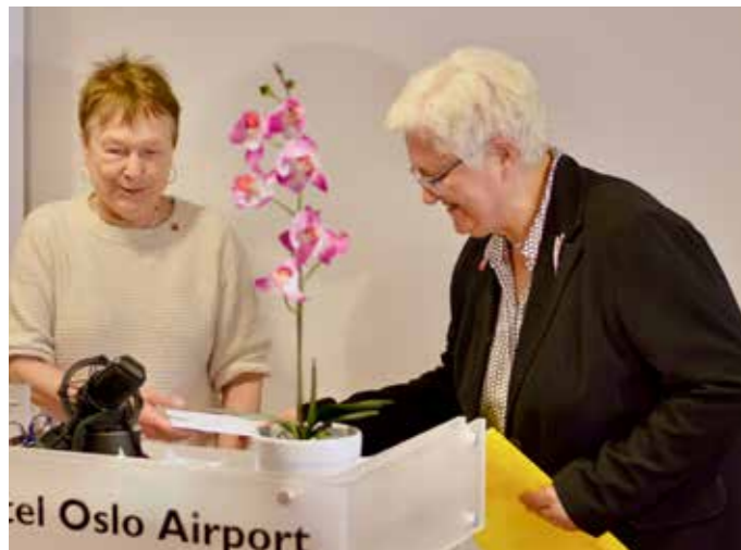
Avtroppende og påtroppende styreleder

LOPs sekretariat og landsmøtedirigenter var samlet på Thon Hotel Oslo Airport, mens foredragsholdere deltok digitalt.