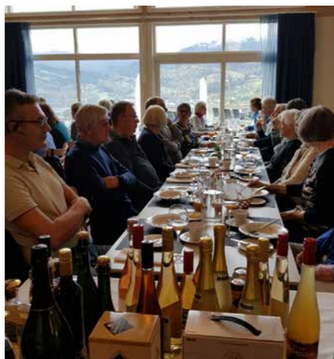
Lunsj på Lekve Gard. I framgrunnen eit utval av sidertypane og brennevin/likør som vert produsert på garden.

Dette året vart midlane frå Den kulturelle spaserstokken nytta til kulturopplevingar i nærmiljøet. 17. okt. reiste 29 både LOP-medlemmer og andre i buss til Haugesenteret i Ulvik. Med 3 frå bygda i tillegg var det i alt 32 deltakarar på turen.