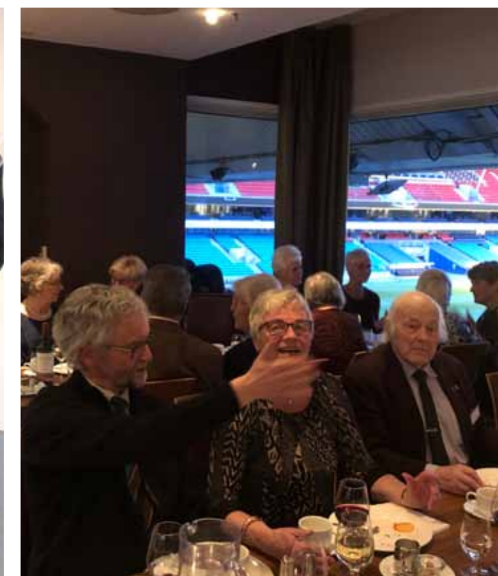
Hyggelig sosialt samvær.