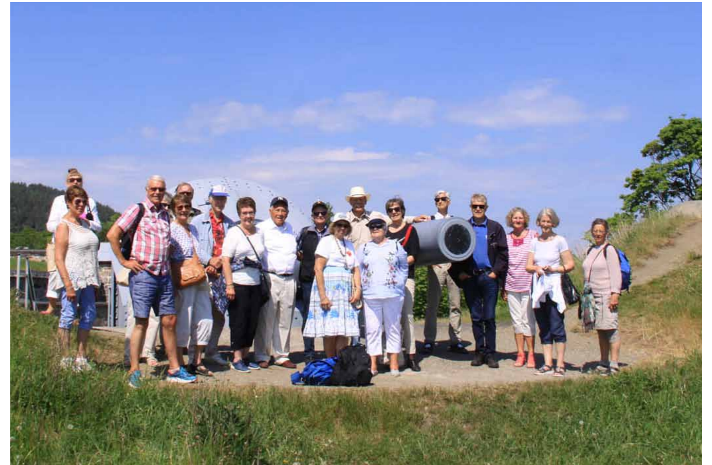
LOP Romerike arrangerte tur til Forsvarsmuseets anlegg på Kaholmene 29. mai 2018. Med sol fra en skyfri himmel ble besøket en minneverdig opplevelse for mange av medlemmene i LOP Romerike.