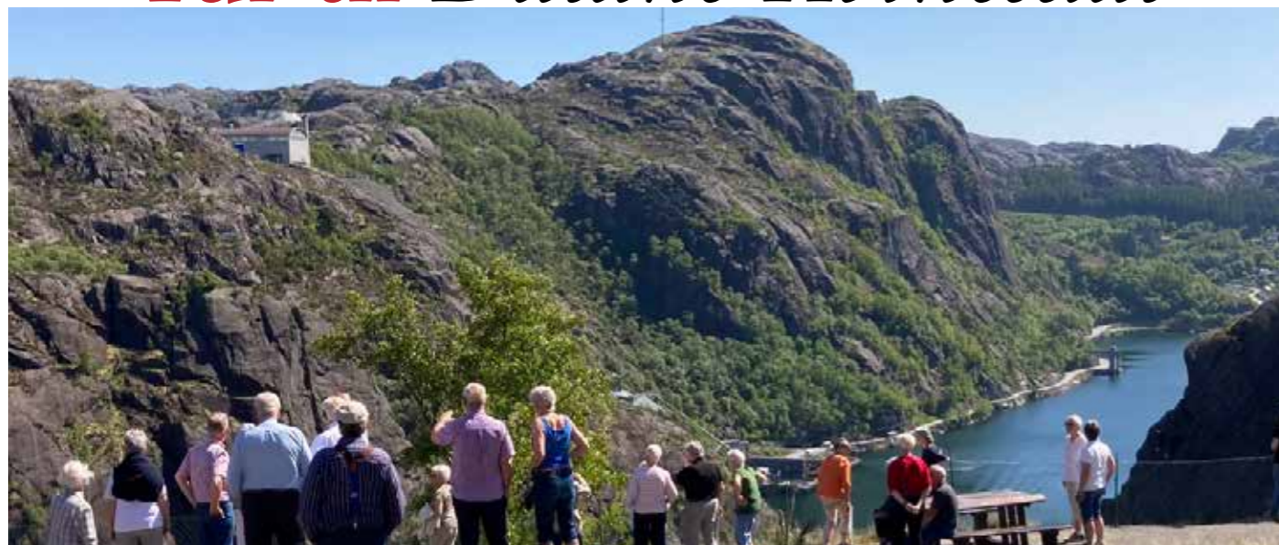
Utsikt fra Utsikten Hotell

Dagstur med overnatting- hva kan nå det være? Jo, en riktig trivelig to-dagers tur med LOP Rogaland sør, fylt med spennende opplevelser, trivelig reisefølge og god mat. 6. og 7. juni var avsatt til denne turen, vi var totalt 40 deltagere.