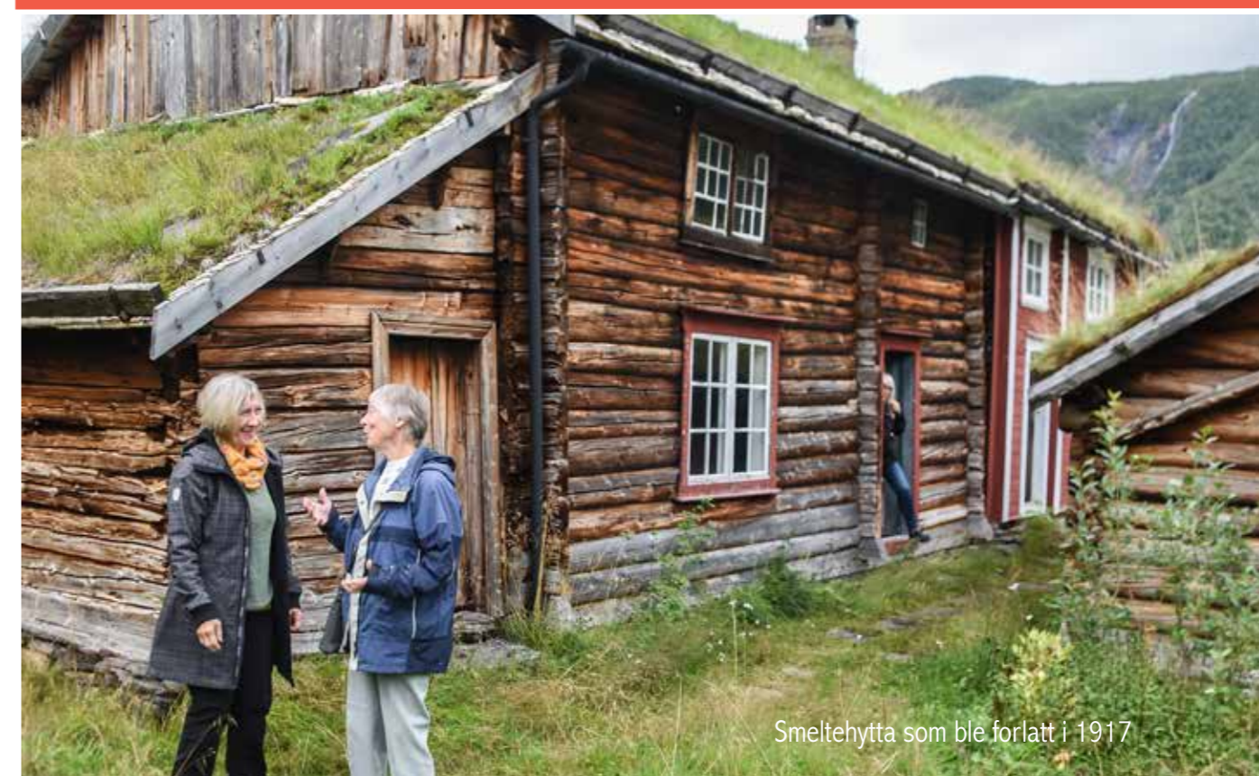
Smeltehytta som ble forlatt i 1917

I studien som er utført ved NTNU så man at både fysisk og psykisk livskvalitet var bedre hos de eldre som trener med høy intensitet, enn hos de som mosjonerer i et mer moderat tempo. MEN: Alle monner drar, og alle typer mosjon viste gode effekter.