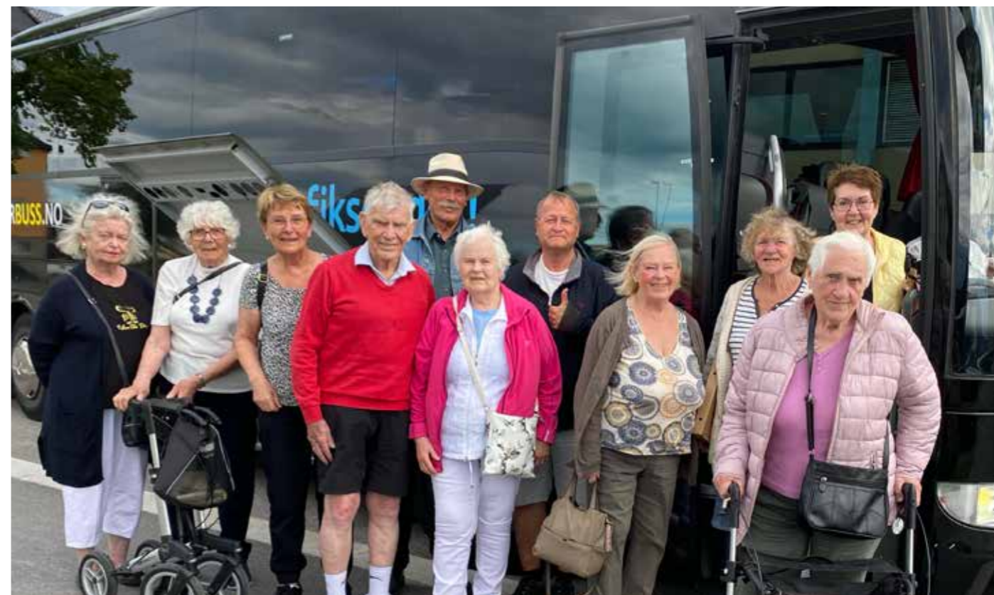
Hele gjengen klar for siste etappe i Charterbuss