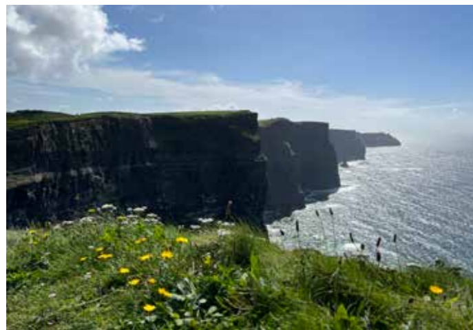
Cliffs of Moher

Lunsjen første dag var et STORT møte med irsk mat. Porsjonene vi fikk både da og ved senere fellesmåltider, var våde velsmakende og godt voksne. Gjennomsnittlig vektøning per person disse seks dagene ble nok ca 2 kg!