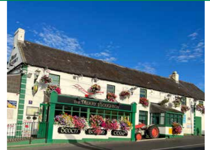
Avslutning med Riverdance