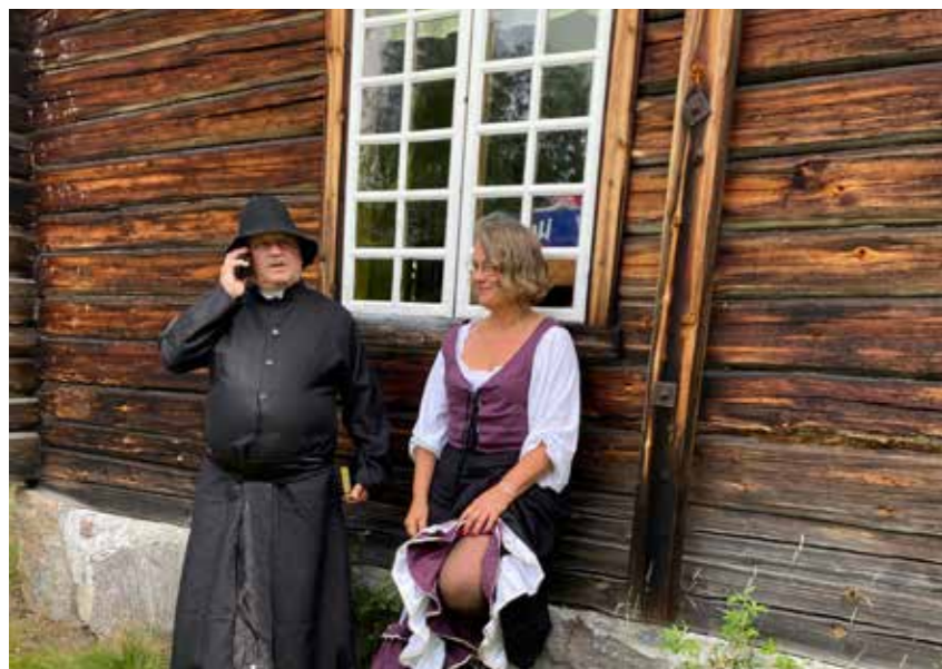
Nye og gamle tider, skogfinneantrekk og mobil telefon ...