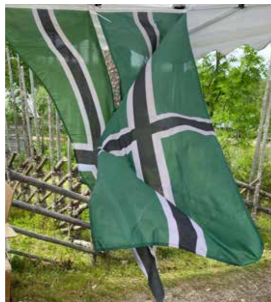
Republikken har både fane og flagg

Finnskogen eller Finnskogene er et stort sammenhengende skogområde langs riksgrensen mellom Norge og Sverige, nærmere bestemt mellom Solør i Norge og Varmland i Sverige. Området har fått navnet etter finske innvandrere som gikk fra Savolax i Finland til Sverige. Der ble de sendt videre til Norge med kongelig løfte om økonomiske fordeler hvis de forlot Sverige. Innvandringen startet på 1570-tallet og pågikk til rundt 1630.