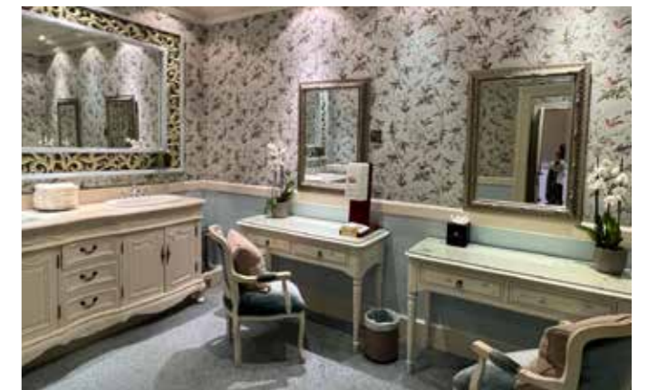
Afternoon Tea Dametoalletet

Forkjæling på høyt plan! Dette fortsatte om kvelden; middelalderbankett på Knappogue Castle. Flotte kostymer, fengende underholdning, velsmakende mat. Topp aften!