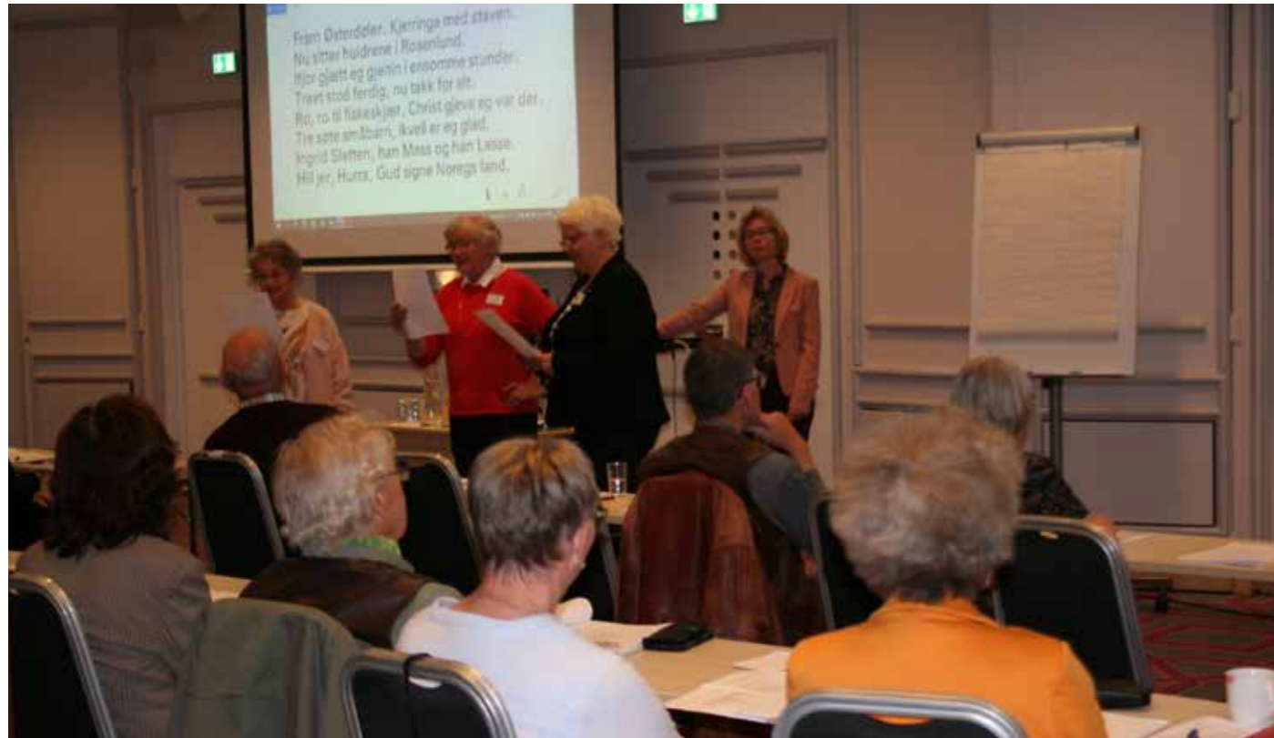
Møtet ble åpnet med både dikt og allsang

til eldreomsorgen, det ble satt fokus på samordningsfella, og det ble poengtert at en økning i minstepensjoner må bety tilførsel av friske midler slik at ikke disse midlene tas fra dem med opptjente rettigheter som gjennom et langt yrkesliv har betalt inn for sin pensjonsordning.