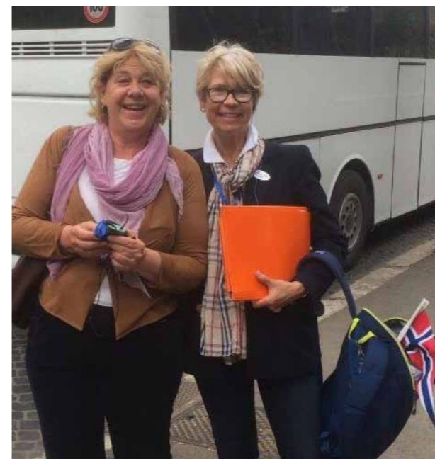
Vår flotte reiseleder sammen med den lokale guiden.

På turen hadde vi mange felles måltider. Vi fikk smake på Italienske spesialiteter og koste oss sammen på hyggelige restauranter med nydelig mat og god drikke.