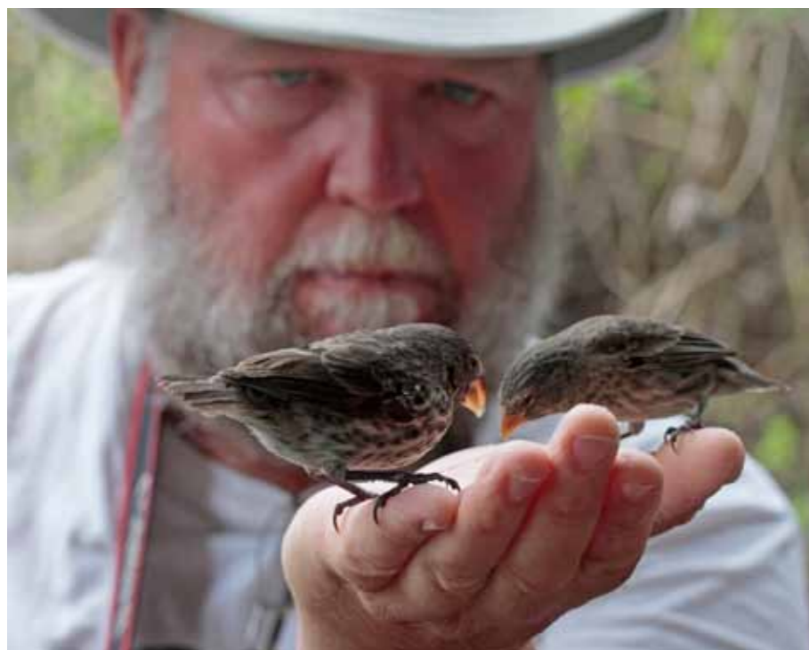
Skjelstad med darwinfinker – en art som er blitt observert av et ektepar i 40 år på Galápagosøyene.

Tekst: Maj Lindholt, Foto: Odd Westeengen