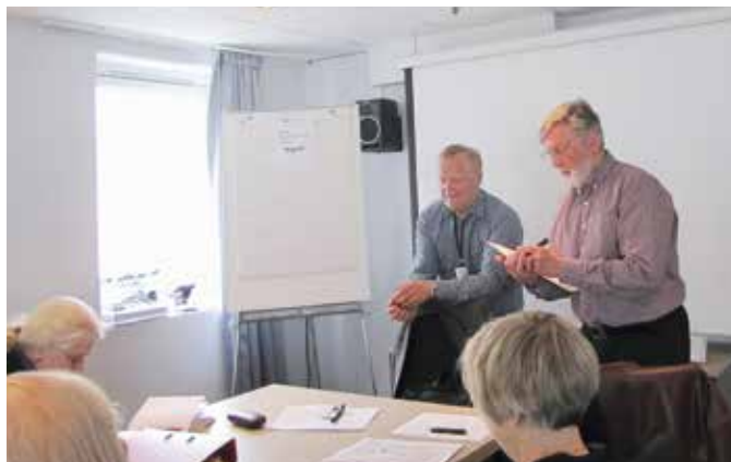
◀ Øie svarer på spørsmål og Helland styrer debatten.