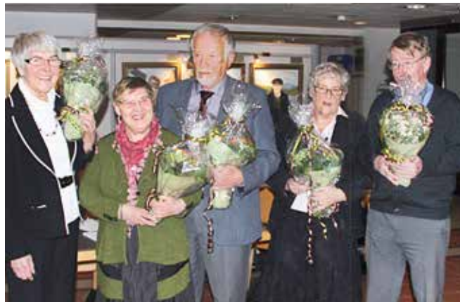
Styret som gikk av.

utenlandsreiser, 5-6 dagsturer til Finland og gjerne en eller to turer i vårt vakre Troms fylke. I år går turene til Sverige, Kreta og Gran Canari, og i Troms skal vi til Mallangen Brygge og til Fjellandsbyen i Målselv. Og selvsagt har vi allerede avviklet en flott møljetur, vi som bor i skreiens rike. Vi tar gjerne imot pensjonister som er på besøk fra andre LOP avdelinger.