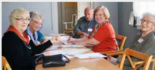
Gruppearbeid er gøy!