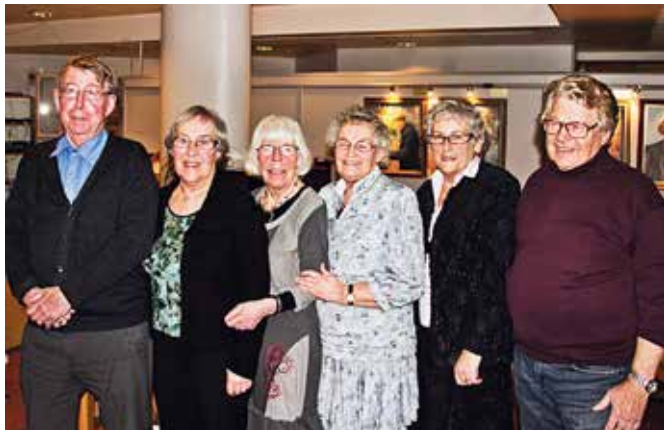
Det nye styret.

Tekst: Laila Jernsletten . Foto: Frits N. Jensen