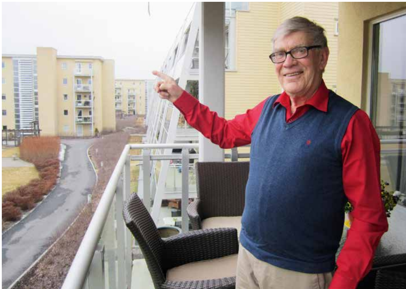
Bak det huset ligger Doktorgården hvor Nedre Romerike har lokallagmøter!