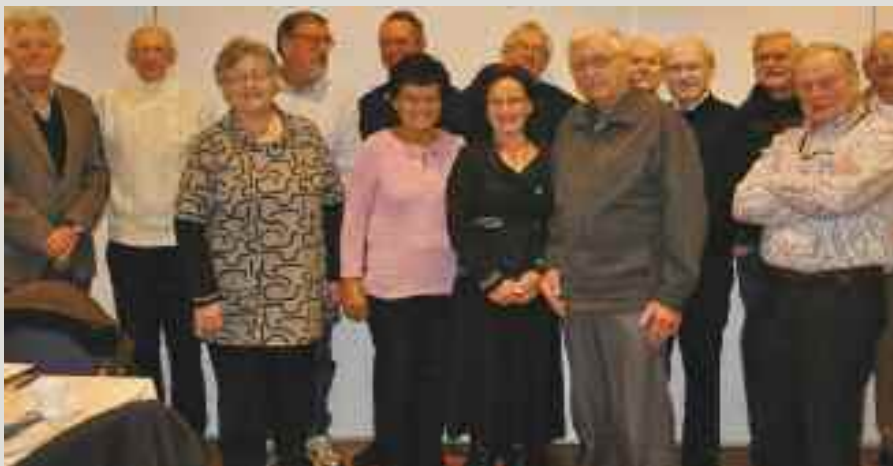
Et av våre nyeste lokallag, Mattilsynets pensjonistforening Rogaland og Agder presenterer noen av medlemmene som var til stede på et møte.