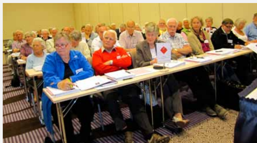
Avtroppende sentralstyre på det vellykkede landsmøtet 2011 i LOP Sandnes og Jærens regi.

Sentralstyret søker vertskap til neste landsmøte som planlegges avholdt 12.-14. juni 2014.