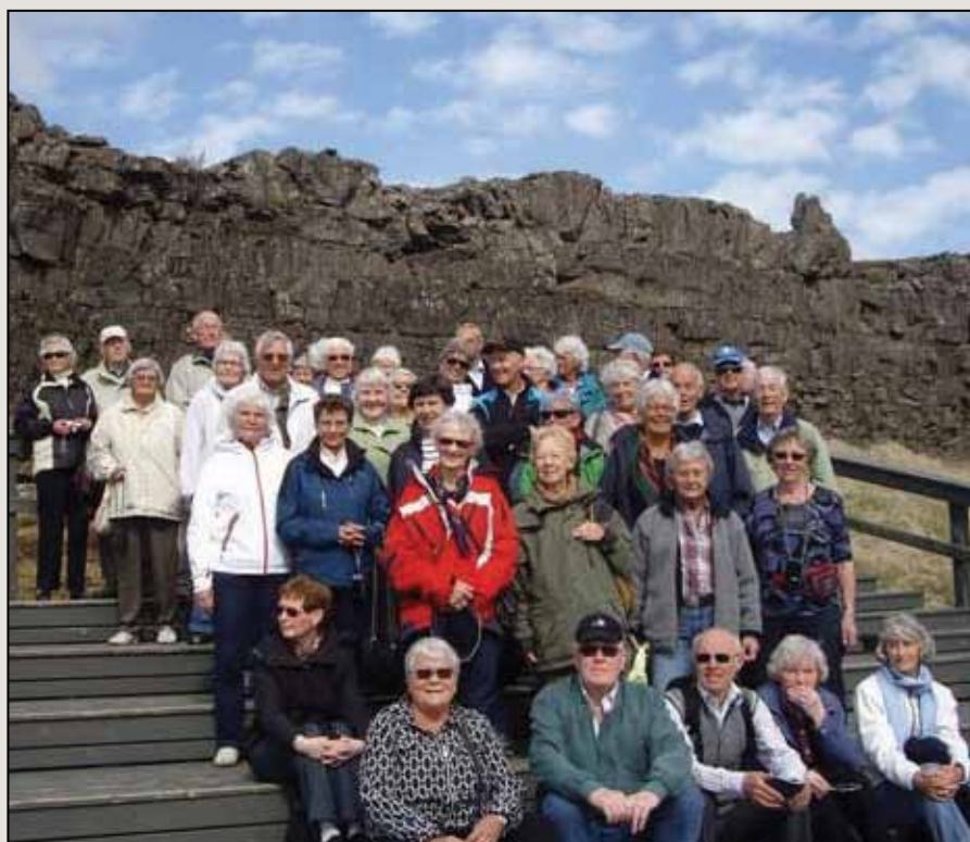
Her er alle samlet ved det gamle Alltinget

Førti reiseglade LOPere med venner dro fra Tønsberg med kurs for Island, vulkanenes øy.