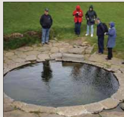
Snorre Sturlasons varmebasseng (heita pottur) i Reykholt

Det har på alle måter vært en vellykket tur. Så annerledes enn vårt eget land, så