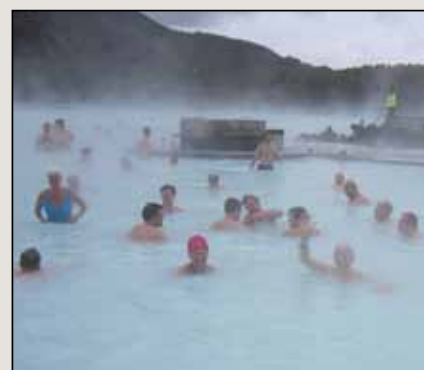
Den blå Lagune

På søndag gikk turen langs den lange fjorden Hvalfjörður til Borgarfjörður. Vi kjørte ned i den nye, første undervannstunnelen på Island, nesten 5 km lang. På turen passerte vi flere gårder og stoppet ved Borg, hvor vikingen Eigill ”den sterke” Skallagrimsson bodde. På Borgarnes besøkte vi et interessant museum, som beskriver bosetningen på Island og Eigills saga. Med høretelefoner på fikk vi hele historien på norsk mens vi vandret rundt fra post til post og så flotte bilder og modeller fra landet og historien. Deretter dro vi til Hraunfossar og Barnafoss.